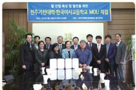
전주지전대학교 MOU 체결