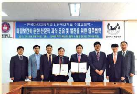
전북대학교 수의학과 MOU 체결