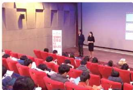
영화로 하는 심리치료