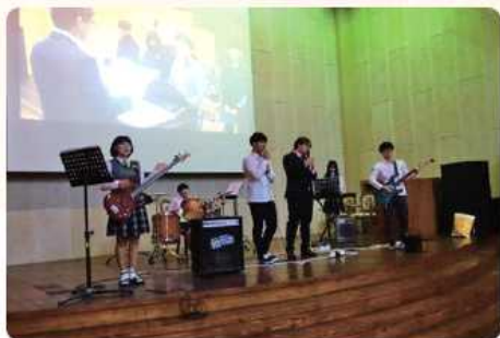
동아리 축제 (소화제)